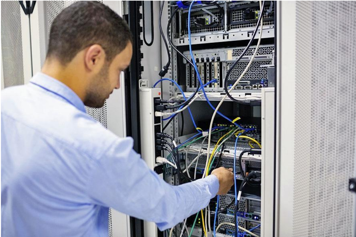
Figuur 1: de netwerktechnicus bij Evoliris

Maar laten we beginnen bij het begin ... Wat is precies een "PC/Netwerk Support Technicus"?